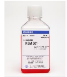
コージンバイオ社製品