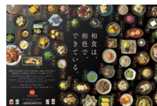
「和食は、和色でできている」