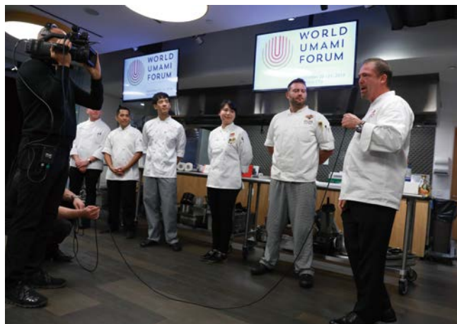
World Umami Forum パネルディスカッション風景(左)、料理コンテスト風景(右)

また、生活者へのダイレクトコミュニケーションについては、インターネットやSNS等の新メディアの登場で、より一層情報が氾濫する中、生活者との直接の接点を