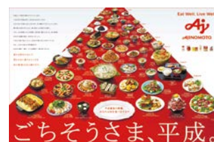
「ごちそうさま、平成。」

製品コミュニケーションでは、多様化する生活者の動線に合わせたメディア活用、クリエイティブ制作に努め、伸長するデジタル化への対応力を高め、テレビほか既存各媒体と組み合わせた統合コミュニケーションを推進している。特にマーケティング戦略に基づくプランニング等の強化や広告の編集記事化、営業活動とのさらなる連動により生活者への浸透に注力した。シニア(BS放送での健康に配慮した製品CM等)や若年層・ティーン層(中学生から大学生、スマートフォン広告やWebでの料理の作り方動画等)といったこれまであまり広告の中心対象としてこなかった年齢層へのアプローチも開始し、対象を広げた。広告内容においては、「おいしさNo.1」を伝えるシズル表現 4 を強化し購買意欲を促進した。また、共食・野菜摂取・簡便性といった社会課題を取り込み、これを解決する商品として提示することでファン拡大を図っている。