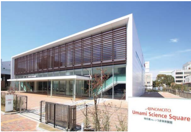
味の素グループうま味体験館