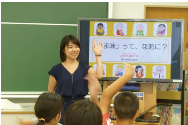
出前授業「だし・うま味のひみつ」

また、生活者へのダイレクトコミュニケーションについては、インターネットやSNS等の新メディアの登場で、より一層情報が氾濫する中、生活者との直接の接点を